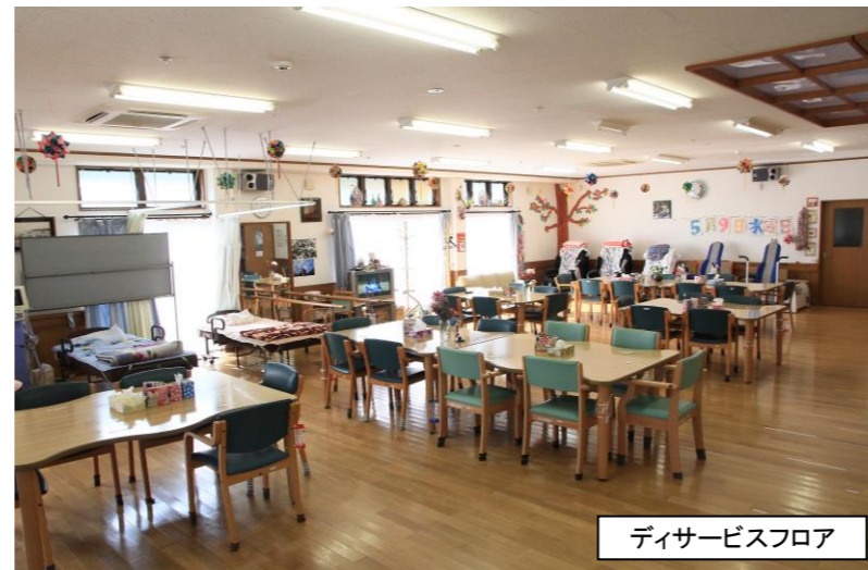
ディサービスフロア

■ ディサービス とは、要介護者、要支援者及び事業対象者がディサービスセンター等の施設に通い、その施設において食事、入浴、排泄等の介護、その他日常生活上の世話及び機能訓練のサービスを提供します。