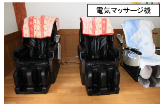
電気マッサージ機