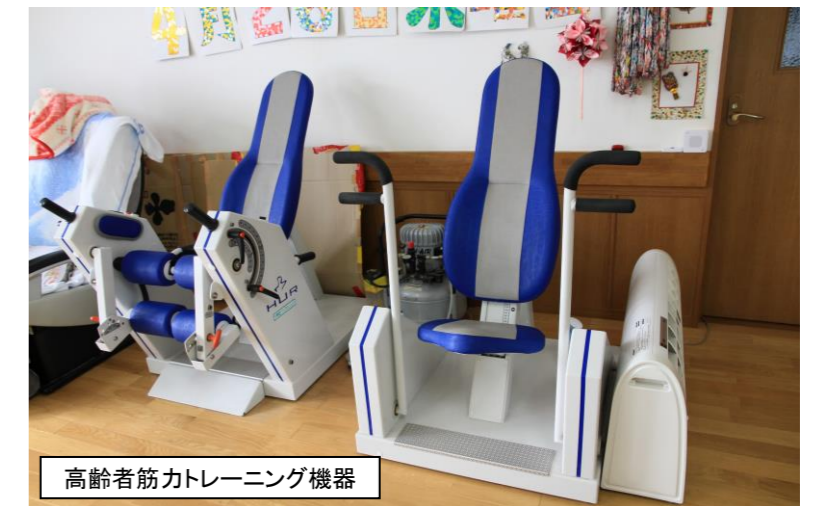
高齢者筋力トレーニング機器