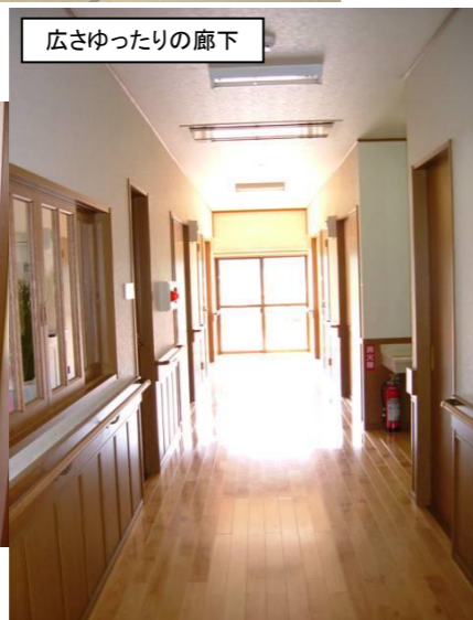
広さゆったりの廊下