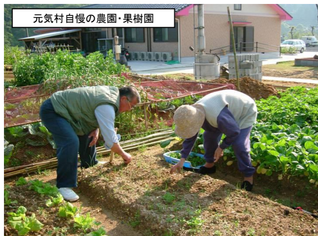
元気村自慢の農園・果樹園